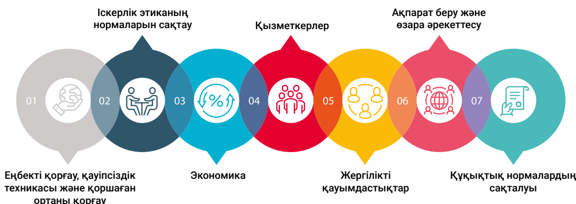
7-сурет. «КПО іскерлік қағидалары» негізгі жеті категорияны қамтиды:

«КПО іскерлік қағидалары» құжатының толық нұсқасын және таныстырма бейнебаянын КПО сайтындағы Іскерлік этика бөлімінен тауып таныса аласыздар.