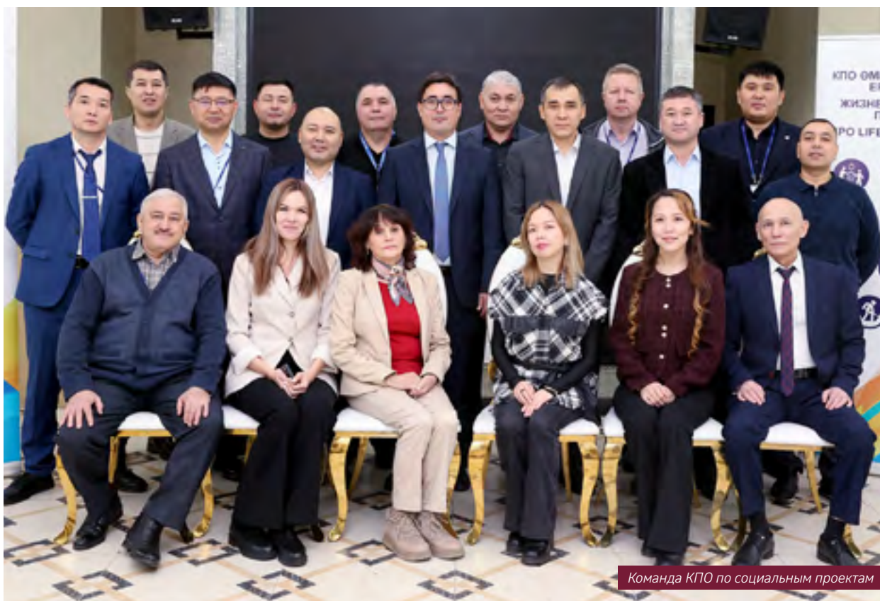
Команда КПО по социальным проектам

Эти онлайн-мероприятия, проводимые в течение года, способствовали созданию атмосферы сотрудничества, укреплению отношений между компанией и местными организациями и, как следствие, достижению амбициозных целей Компании в области МС. В вебинарах приняли участие представители более 150 местных производителей и иностранных компаний, которые заинтересованы в локализации или намерены ее осуществить.