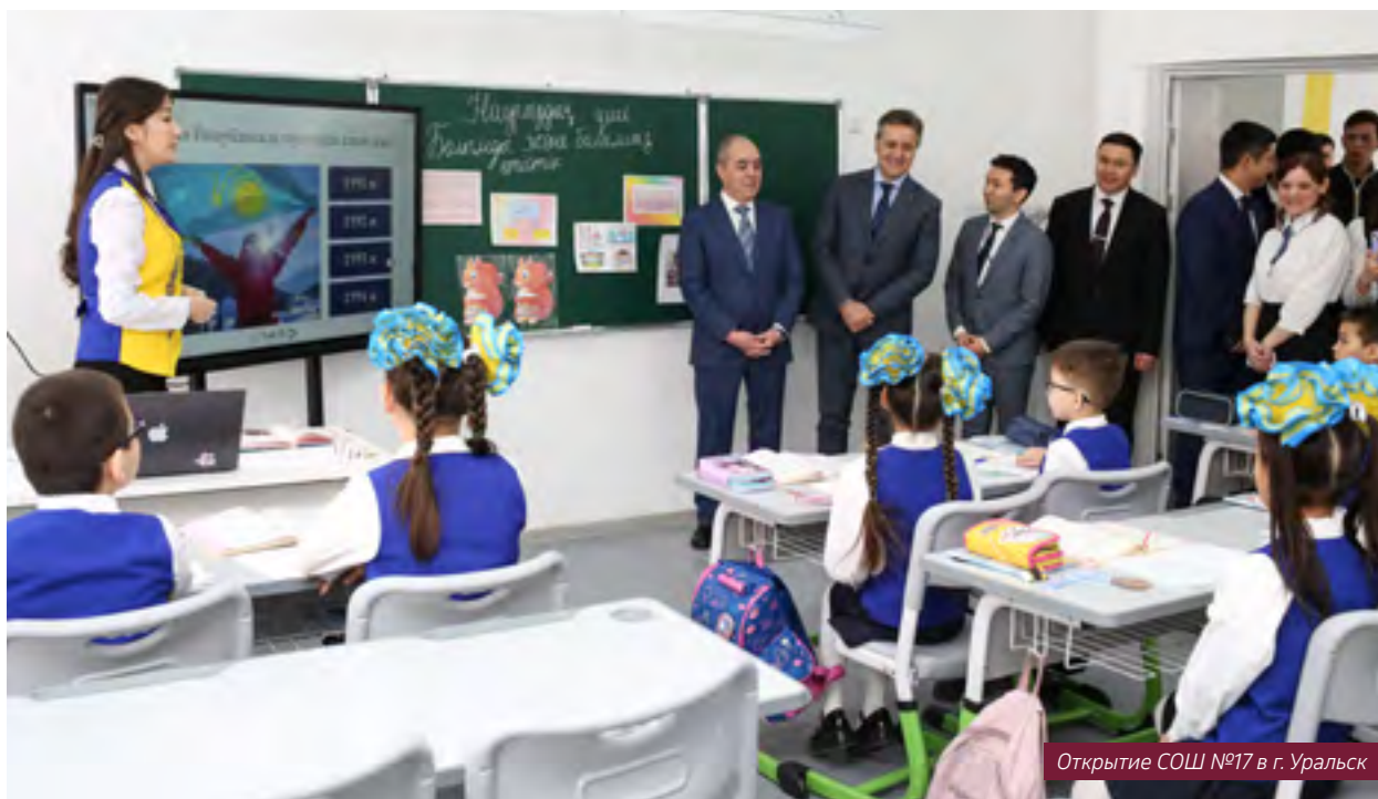
Открытие СОШ №17 в г. Уральск

Новые школы соответствуют всем современным требованиям, и в них созданы максимально комфортные условия для учебы. Учебные заведения оснащены всем необходимым оборудованием и кабинетами, включая актовЫй зал, спортивный зал с отдельными душевыми и санузлами, учебными кабинетами, современной столовой и кабинетами администрации. Школы полностью укомплектованы современным учебным оборудованием и сдаются под ключ. / ЦУР 4.а /