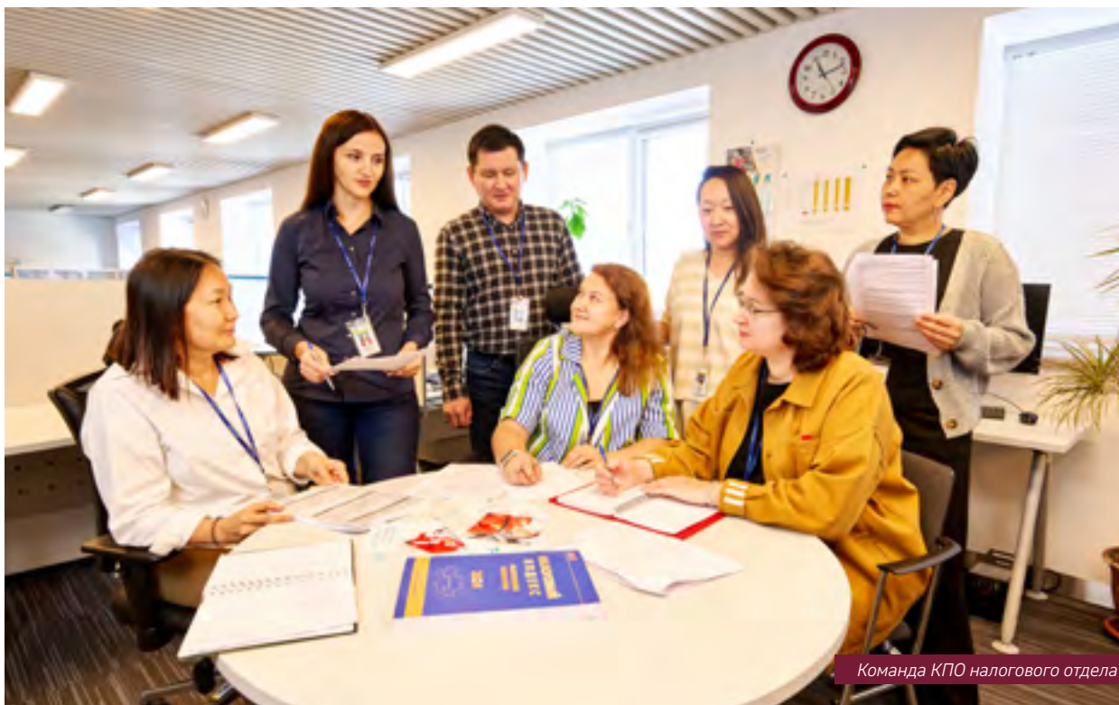
Команда КПО налогового отдела

** Начиная с 2020 г. при конвертации с казахстанского тенге в долл. США КПО выполняет расчет по курсу на момент оплаты в соответствии с внутренней системой бухгалтерского учета SAP, а не по курсу НБ РК на конец отчетного периода.