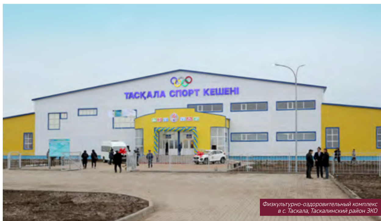
Физкультурно-оздоровительный комплекс в с. Таскала, Таскалинский район ЗКО