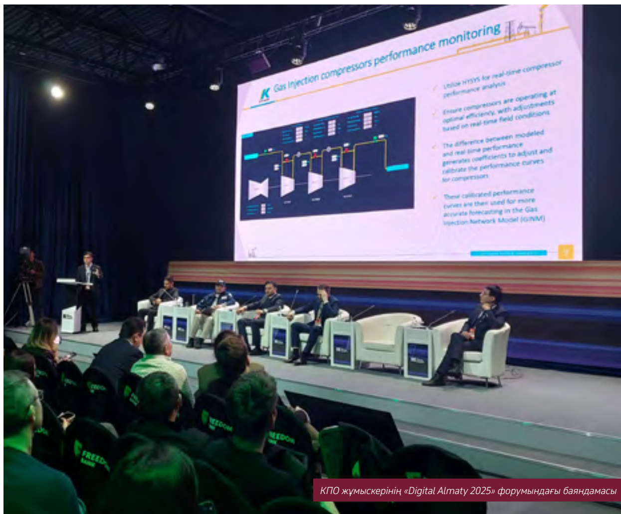
КПО жұмыскерінің «Digital Almaty 2025» форумындағы баяндамасы