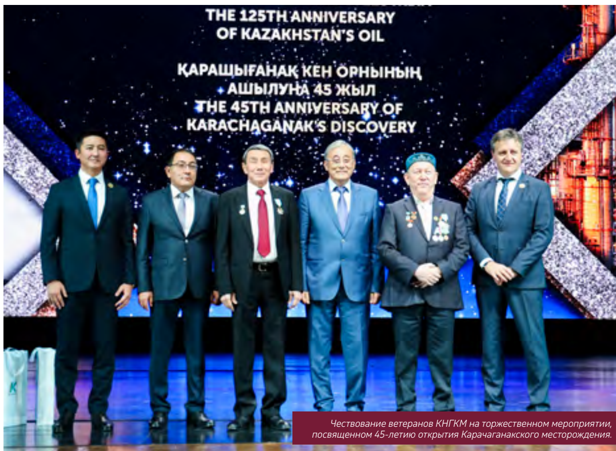
Чествование ветеранов КНГКМ на торжественном мероприятии, посвященном 45-летию открытия Карачаганакского месторождения.

Более подробно о взаимодействии КПО с IMBC говорится в главе «Развитие местного содержания».