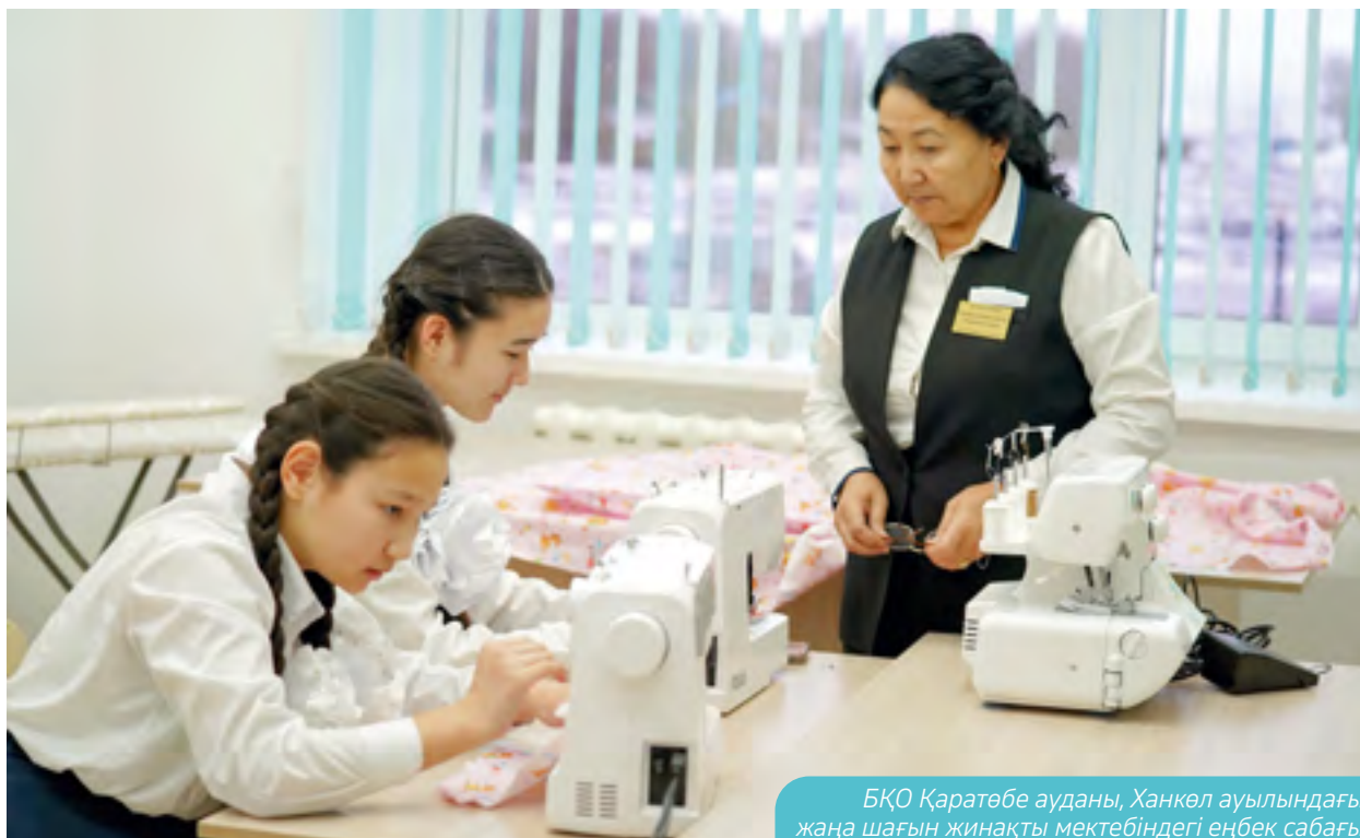
БҚО Қаратөбе ауданы, Ханкөл ауылындағы жаңа шағын жинақты мектебіндегі еңбек сабағы

Сонымен қатар, 2023 жылы бұрынғы Березовка және Бестау ауылдары жерлерінің топырақ құнарлылығын қалпына келтіру жобасы әзірленді.