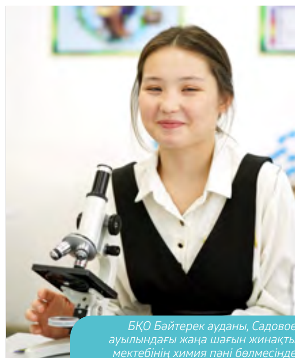
БҚО Бәйтерек ауданы, Садовое ауылындағы жаңа шағын жинақты мектебінің химия пәні бөлмесінде

КПО ҚР-ның салық салу саласындағы заңнаманы қатаң ұстанып, салықтық қатынастарды мұнайгаз және тау кен саласындағы кірістер мен есеп берудің ашықтығын қамтамасыз ететін өндіруші салалардың ашықтығы бастамасы бойынша әлемдік стандартына сай жүргізіп келеді.