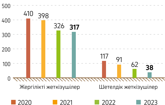
27-сызба. 2020–2023 жж. КПО жеткізушілері және мердігерлері