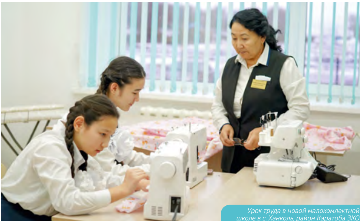
Урок труда в новой малокомплектной школе в с. Ханколь, район Каратопа ЗКО

Кроме того, в 2023 году был разработан проект по рекультивации территории бывших с. Березовка и с. Бестау.