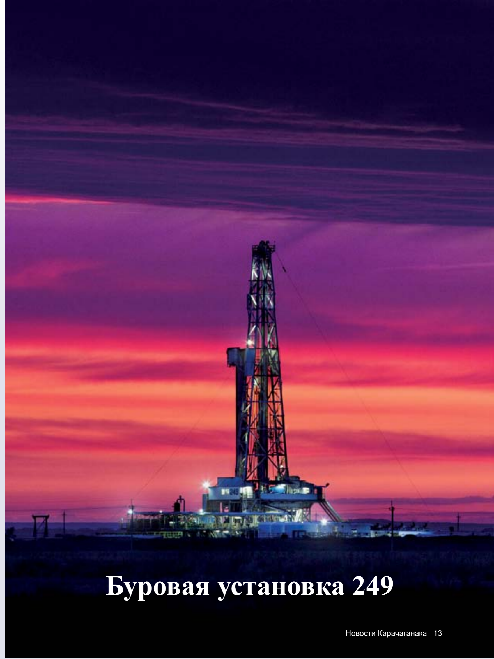
Буровая установка 249